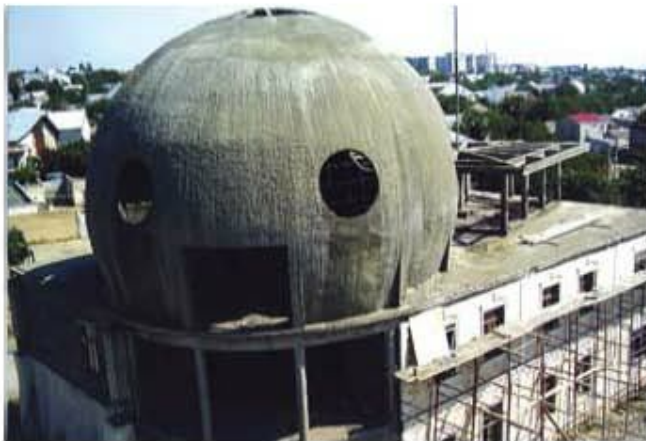
Железобетонная оболочка свая конструкция «Шар» используется в строительстве как нанотехнология «Эко-бетон»

В своей практике фирма неизменно поддерживает новаторский стиль работы, внедряя современные передовые технологии. Так, ЗАО ПСФ «ГРАНТСТРОЙ» практикует применение технологии защиты строительных конструкций методом гидроабразии, проводит кровельные и гидроизоляционные работы на основе мембраны ТЭПК и устройство монолитных самовыравнивающих наливных цементных однослойных полов. Возводя различные объекты в зонах с повышенной сейсмичностью и на просадочных грунтах, компания накопила богатый опыт работы в сложных инженерно-геологических условиях.