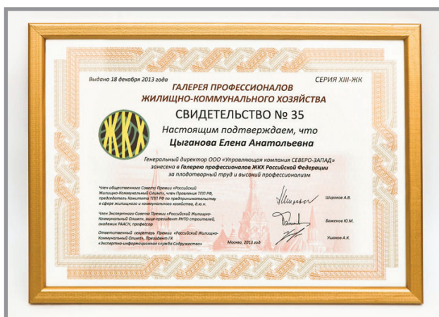
Свидетельство о занесении в «Галерею профессионалов жилищно-коммунального хозяйства»