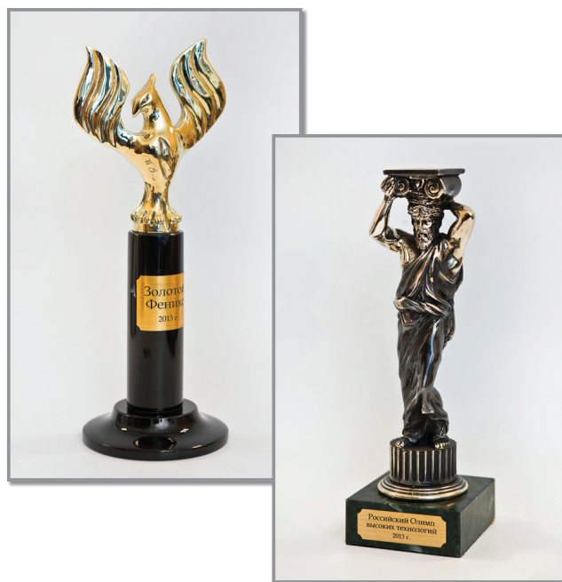
Призы Премий «Золотой Феникс–2013» и «Российский Строительный Олимп–2013»

Программы проводятся при поддержке Правительства Москвы, администраций субъектов Российской Федерации, Торгово-промышленной палаты Российской Федерации, Российского союза промышленников и предпринимателей