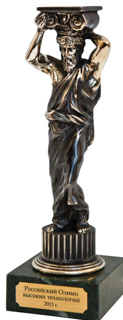
Интернет-журнал «Нанотехнологии в строительстве» – лауреат премии «РОССИЙСКИЙ ОЛИМП ВЫСОКИХ ТЕХНОЛОГИЙ–2013»

Интернет-журнал «Нанотехнологии в строительстве» признан лауреатом премии «РОССИЙСКИЙ ОЛИМП ВЫСОКИХ ТЕХНОЛОГИЙ–2013» в номинации «За продвижение на российский рынок новых наукоёмких технологий (прежде всего – нанотехнологий в строительстве и ЖКХ), имеющих важное значение для страны». Большое спасибо организаторам за столь высокую оценку!