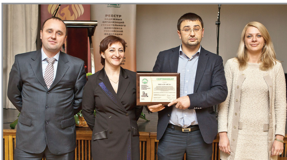
Группа сотрудников ООО «Строительно-эксплуатационное управление «Фундаментстрой-6» с сертификатом программы «Передовые организации жилищно-коммунального хозяйства–2013»

в номинации «Информационный партнёр» – за вклад в освещение деятельности строительных компаний и активную информационную поддержку программ «Российский Олимп»;